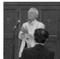
平成23年度通常総代会/平成23年6月15日(水)、「パーテーギャラリーイヤタカ」にて