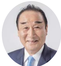
秋田県火災共済協同組合 理事長