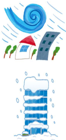
風・雹・雪災、水災による支払共済金の推移

平成30年度までの自然災害の影響を反映した前回の改定以降も令和元年度台風15号による風災、台風19号による水災、令和2年度の爆弾低気圧による雪災といった大規模な自然災害が発生し、自然災害のリスクが一層高まっていることから、共済掛金を改定いたします。